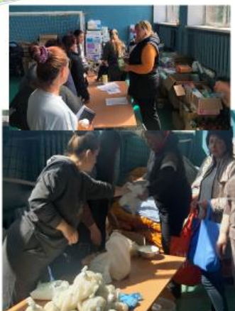
Ми – волонтери