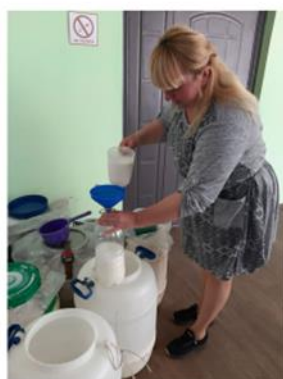
Ми - волонтери